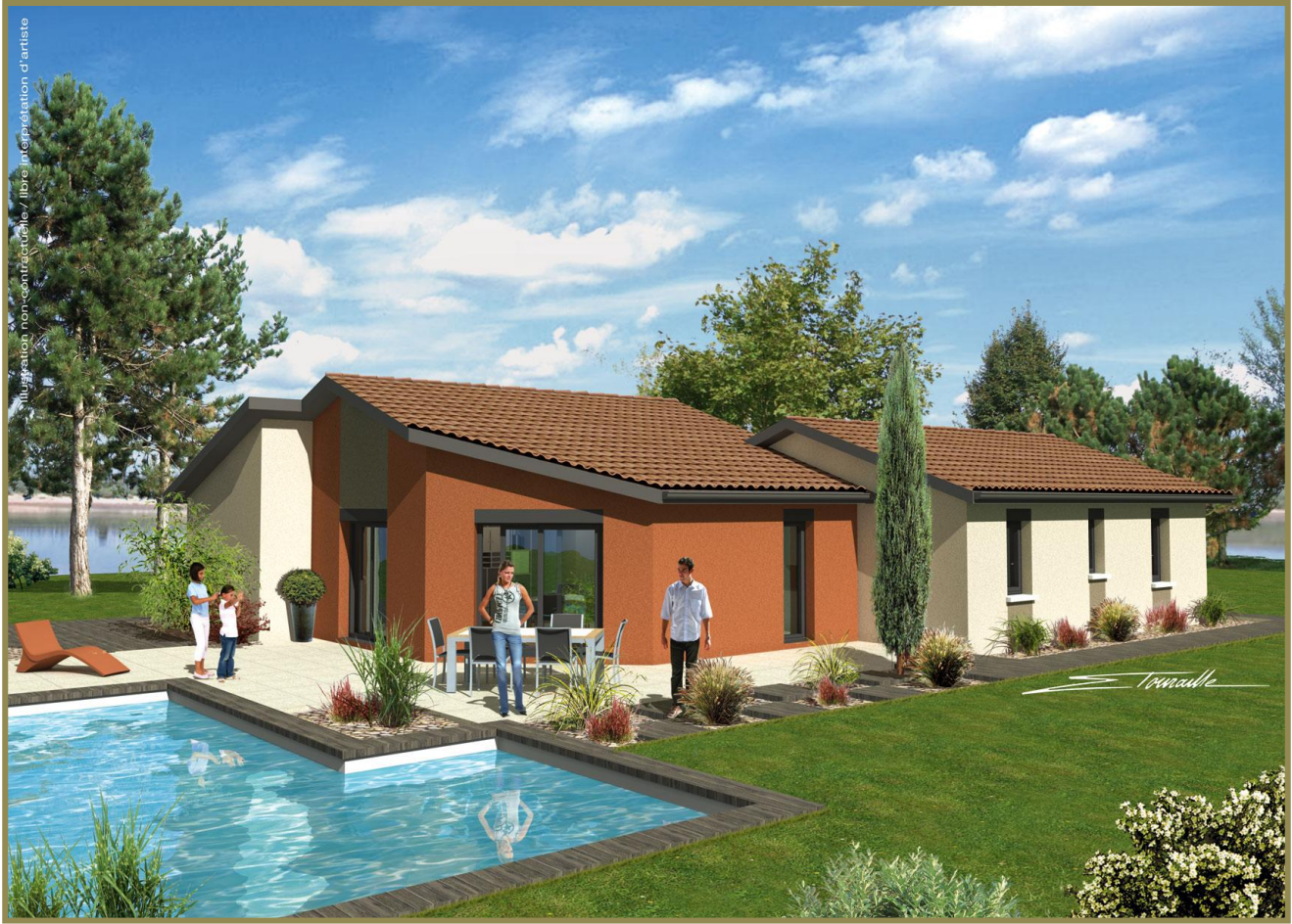
*Maison conforme à la norme Très Haute Performance Energétique