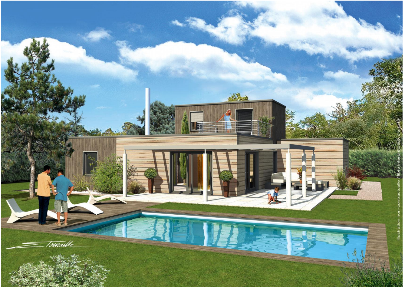
Illustration non-contractuelle - libre interprétation d'agence

*Maison conforme à la norme Très Haute Performance Energétique